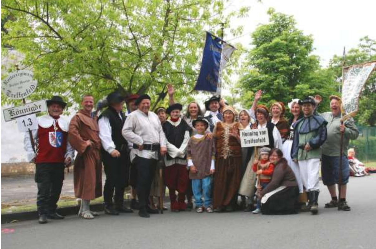
der Treffenfeld Verein

Homepage: https://www.hvtreffenfeld-koennigde.de