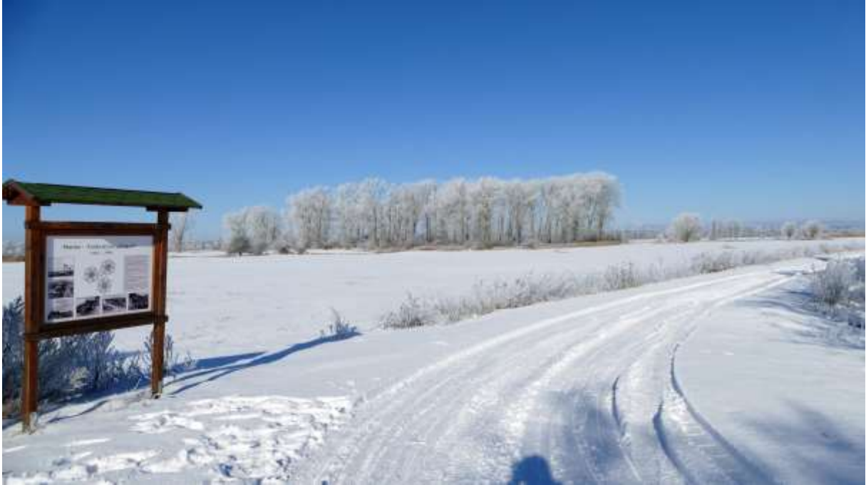
Wanderstützpunkt am Goliath

Im Hintergrund, dort wo die alten Pappeln zu sehen sind, stand einmal das Hauptgebäude des Marinesenders „Goliath“.