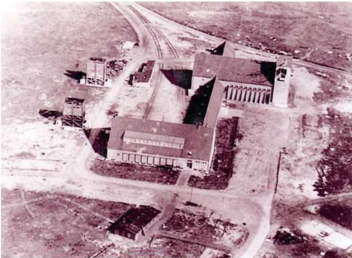
Sendezentrale des Marinesender Goliath um 1942

Im Hintergrund, dort wo die alten Pappeln zu sehen sind, stand einmal das Hauptgebäude des Marinesenders „Goliath“.