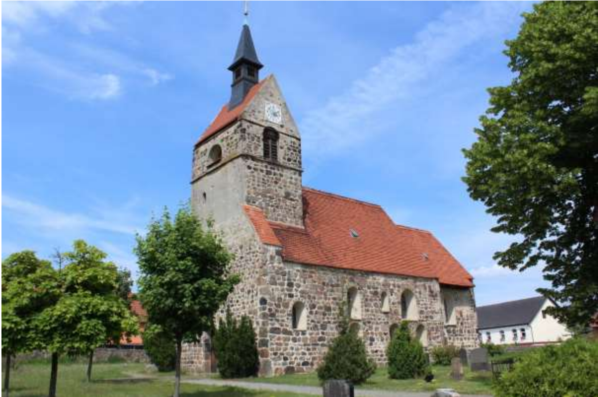
Kirche von Altmersleben

Wir fahren aber geradeaus über die Landstraße. Nach dem wir den Wald erreicht haben, biegen wir an der nächsten Abzweigung nach links ab – Richtung Bornholdtsee Nr. 4.