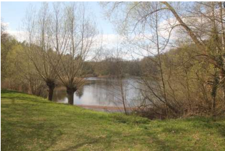
Der Bornholdt Teich

Wir fahren aber geradeaus über die Landstraße. Nach dem wir den Wald erreicht haben, biegen wir an der nächsten Abzweigung nach links ab – Richtung Bornholdtsee Nr. 4.