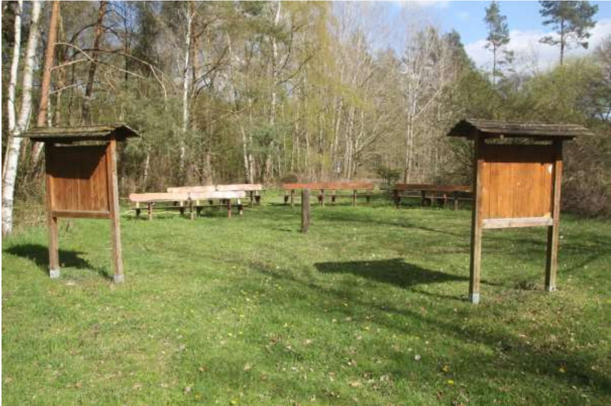
Sitzgruppe am Bornholdt Teich

Auch hier besteht wieder die Möglichkeit einer kleinen Rast.